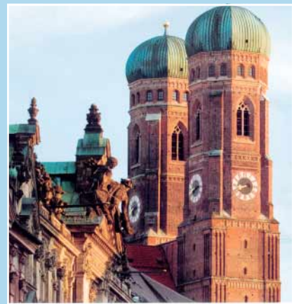
1st Biograph World Summit

Aus aller Welt kamen ca. 260 Nuklearmediziner und Radiologen zu einem Erfahrungsaustausch nach München, dem Hauptsitz der Siemens AG. Im Fokus des Treffens stand die molekulare Hybridbildgebung durch PET/CT und MR/PET. Thematisiert wurden in den Vorträgen an zwei Tagen praktische klinische Fragen in der Versorgung onkologischer, pädiatrischer, kardiologischer und neurologischer Patienten, diagnostische Potenziale bekannter und neuer Isotopen-markierter Biomoleküle, Konsequenzen für die Strahlen- und Chemotherapie sowie ökonomische Herausforderungen.