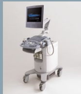
ACUSON X150 Seite 39-42