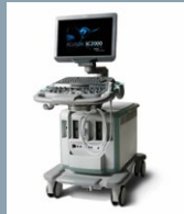
ACUSON SC2000 Seite 5-8