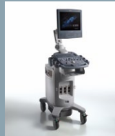
ACUSON X300 Seite 35-38