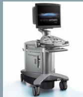
ACUSON ANTARES Seite 23-26