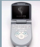
ACUSON P10 Seite 43-44