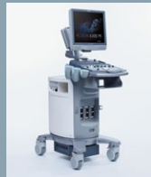
ACUSON X300 PE Seite 27-30