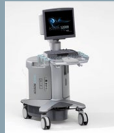
ACUSON S2000 Seite 9-14