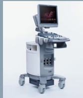
ACUSON X300 PE WI Seite 31-34