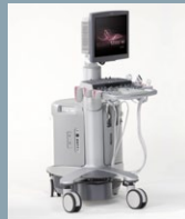
ACUSON S2000 WI Seite 19-22