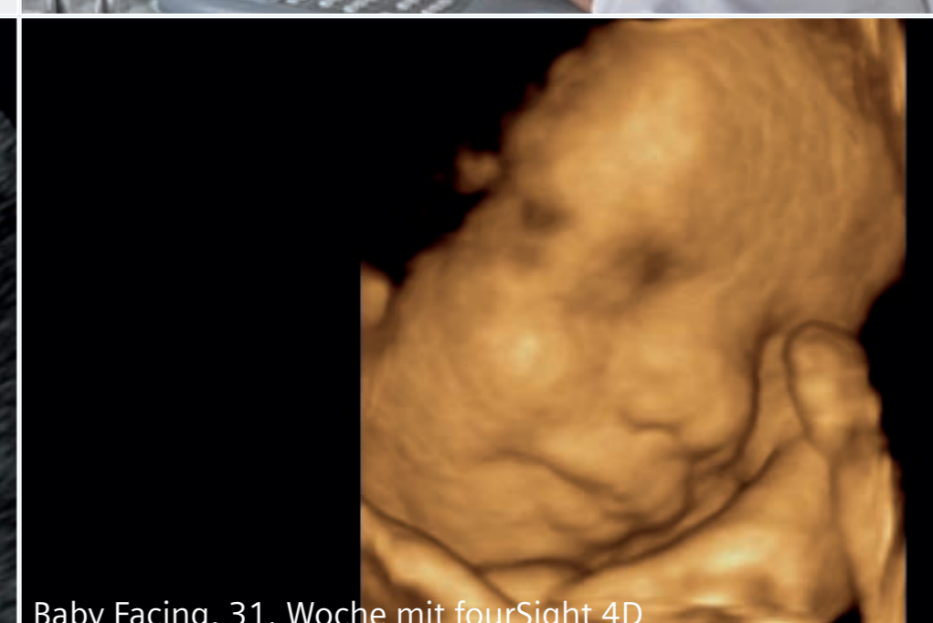
Baby Facing, 31. Woche mit fourSight 4D