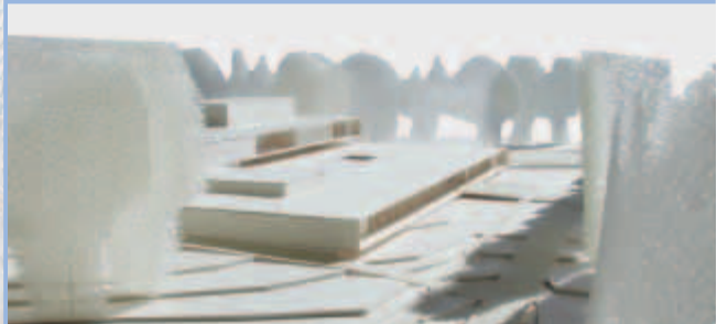
GRUNDRISS UND MODELLANSICHT des Partikeltherapie-zentrums in Marburg. Es ist Teil der Rhön-Klinikum AG, die 45 Kliniken und 14.620 Betten umfasst. (Mit freundlicher Genehmigung der Generalplaner Brenner & Partner, Architekten & Ingenieure Hammes Krause, Stuttgart)