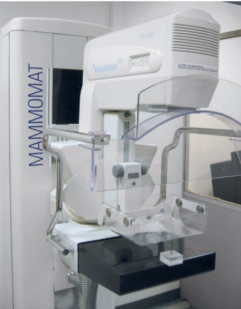
[1] Prototyp für die Tomosynthese, basierend auf dem MAMMOMAT Novation ® -System von Siemens.

primierten Brust aus mehreren Winkeln während des Schwenkens der Röntgenröhre aufnimmt. Objekte unterschiedlicher Höhe in der Brust werden bei verschiedenen Winkeln unterschiedlich projiziert. Während der anschließenden Rekonstruktion, zum Beispiel durch die Methode der gefilterten Rückprojektion (FBP) [6], werden die Objekte einer gegebenen Höhe durch geeignetes Filtern, Verschieben und Summieren verstärkt. Die Rekonstruktion führt letztlich zu einer Reihe von Schichten der unterschiedlichen Tiefenlagen parallel zur Detektoroberfläche. Die Auflösung innerhalb der einzelnen Schichten wird vorrangig durch die Detektorauf- lösung bestimmt und ist normalerweise wesentlich höher als die Auflösung zwischen den Schichten (Tiefenauflösung). Dies lässt sich auf die unvollständigen 3D-Daten des Objekts zurückführen. Der Scan-Winkel ist eigentlich viel kleiner als er für die vollständige Datenerfassung des Objekts für eine volle 3D-Rekonstruktion erforderlich wäre.