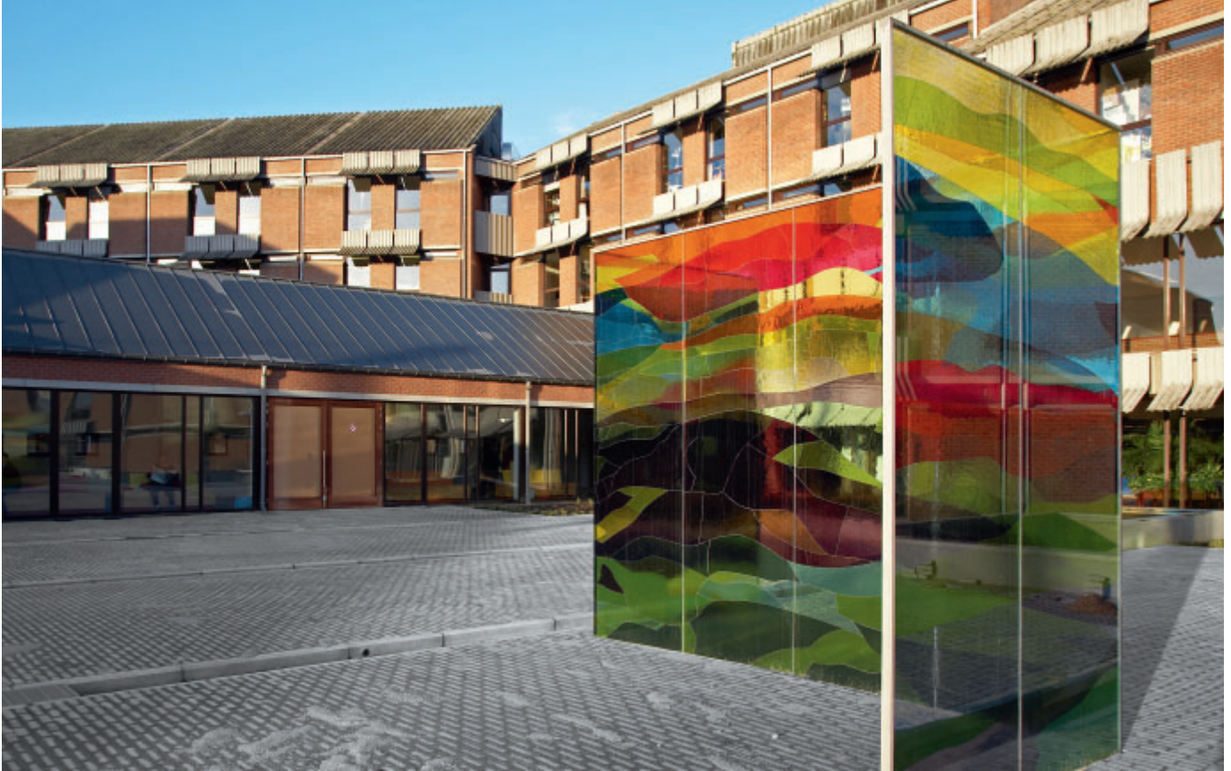
Mit mehr als 2.400 Mitarbeitern und 200 Ärzten ist das Krankenhaus Oost-Limburg in Genk eines der größten nichtuniversitären Krankenhäuser in Belgien.

„AXIOM Luminos dRF ist ausschlaggebend für die gesamte Workflowoptimierung. Weniger Arbeitsschritte, weniger Wiederholungsaufnahmen und vereinfachte Datenintegration führen nicht nur zu höherem Patientendurchsatz, sondern auch zu einer geringeren Fehlerwahrscheinlichkeit.“