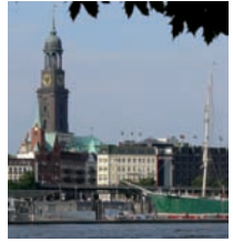
Hamburg April 2011